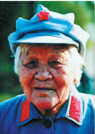
这是卢业香生前留影(翻拍照片)。

据新华社海口4月19日电 (记者周慧敏) 19日上午8时40分左右，我国最后一位红色娘子军老战士卢业香在海南省琼海市中原镇的家中去世，享年100岁。