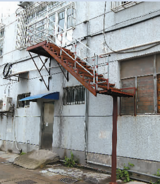
图为违法搭建的铁楼梯。

本报讯(本报记者)昨天，海曙区城市管理局行政执法局向位于海曙区环城西路南段336号的海曙新城中医会馆，送达了《处罚决定书》，限令该会馆从处罚决定书送达之日起10日内，自行拆除违法搭建的铁质楼梯。