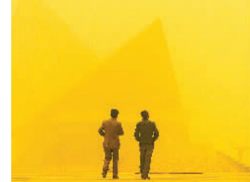
4月24日，两位市民在喀什市东湖景区内行走。随着冷空气的东移，在新疆、甘肃、宁夏等地出现沙尘天气后，内蒙古自治区也于24日出现今年入春以来最大范围大风沙尘天气，当地气象部门已发布沙尘暴黄色和大风霜冻蓝色预警信号，提醒公众做好应对工作。