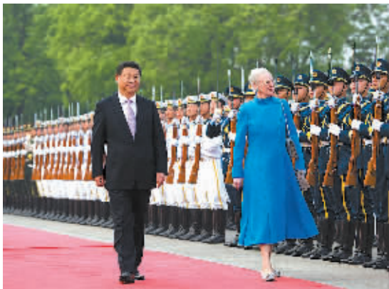
4月24日，国家主席习近平在北京人民大会堂同丹麦女王玛格丽特二世举行会谈。这是会谈前，习近平在人民大会堂东门外广场为玛格丽特二世举行欢迎仪式。