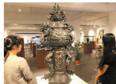
图为展览现场。

本报讯（记者王路）中国当代陶瓷艺术家系列作品开展昨日在市文化馆117艺术中心开展，本次展览从6月18日持续到11月17日，共推出五期陶瓷类艺术家的数百件精品之作。