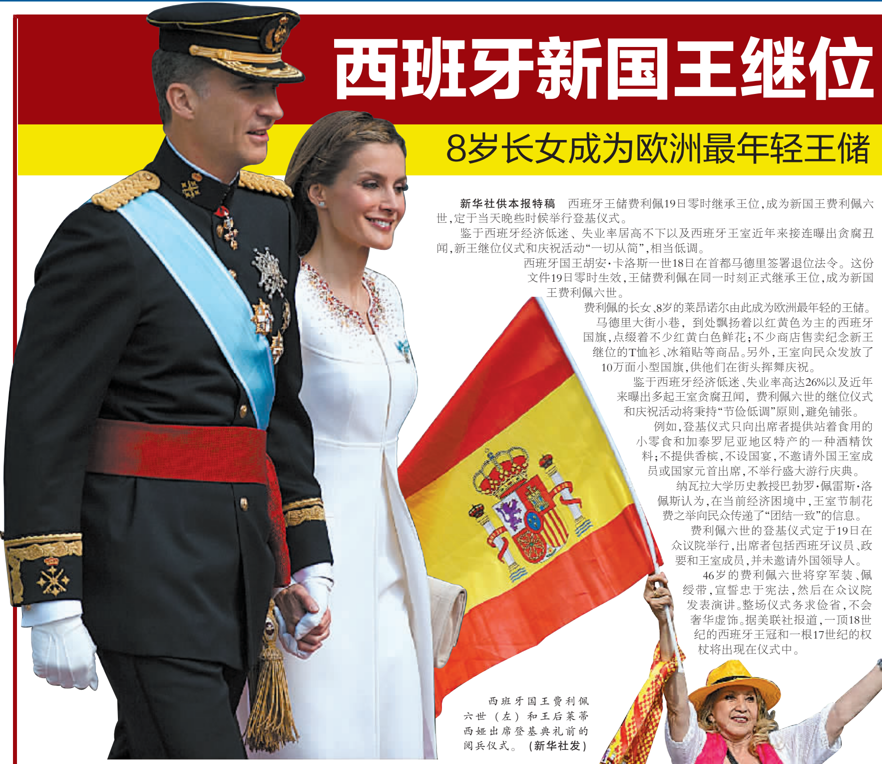
西班牙国王费利佩六世(左)和王后莱蒂西亚出席登基典礼前的阅兵仪式。

46岁的费利佩六世将穿军装、佩绶带,宣誓忠于宪法,然后在众议院发表演讲。整个仪式力求俭省,不会奢华虚饰。据美联社报道,一顶18世纪的西班牙王冠和一根17世纪的权杖将出现在仪式中。