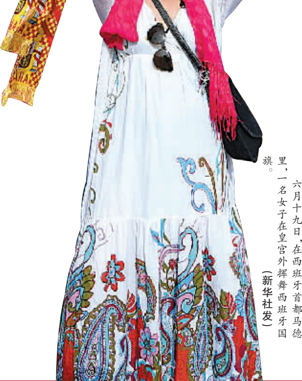
六月十九日,在西班牙首都马德里,一名女子在皇宫外挥舞西班牙国旗。

本月2日,即老国王宣布退位决定当天,一份民意调查结果显示,76.9%的受调查者对费利佩印象好或非常好。(据新华社)