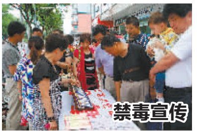
6月26日是国际禁毒日，日前，江北区中马街道在槐树路开展禁毒宣传活动。图为街道工作人员在向路人介绍毒品的类别和危害。

张某看着满地鲜血，也吓傻了，后选择报警。老乡们连扛带抱，立即将李某送到医院治疗。民警从医生处了解到，李某的伤口虽然不长，但有7厘米-10厘米深，深及胸腔。由于出血较多，目前仍在医院观察。此案正在进一步处理中。