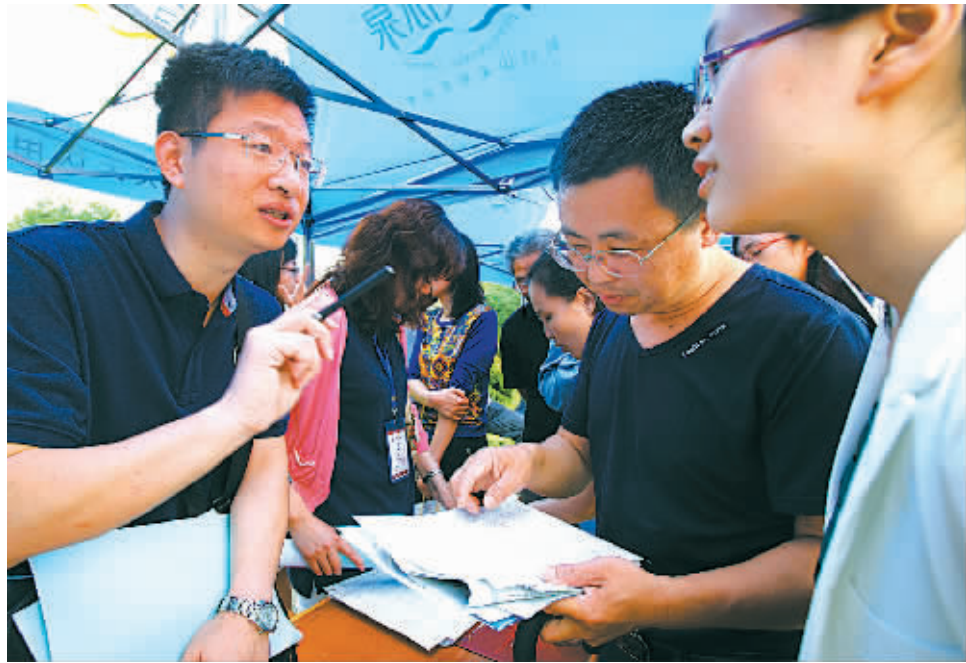
高校招生咨询会现场。