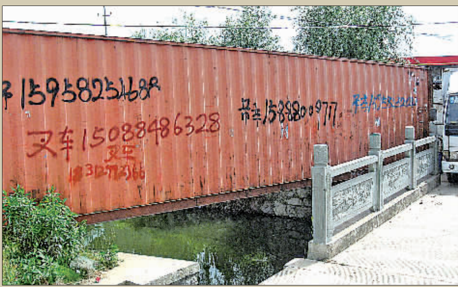
日前,经城管队员上门劝说,横跨在北仑大碇街道富春江南路一条河道上的集装箱“仓库”终于搬家了。据了解,这是附近一家名叫“富春江煤气站”的老板,用来放置空液化气瓶。图为原来横跨在河道两岸的集装箱。