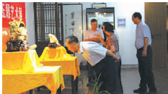
玉雕展。图为观众正在展厅参观。

袁嘉骥生于1954年，是我国杰出的玉雕大师，国家一级工艺美术师，现任湖北省工艺美术研究所副所长。本次展览作品中最能吸引眼球的是袁嘉骥创作的国宝级玉雕作品《佛光照耀》。该作品由一件新疆白玉宝料雕琢而成，佛祖释迦牟尼居中端坐，面容慈善安详，几个憨态可掬的仙童围绕身边，玉石外雕有层峦叠嶂，琼楼玉宇，呈现出一派吉祥和美的景象，是袁嘉骥耗时两年多完成的心血之作。本次展览将持续到6月25日。