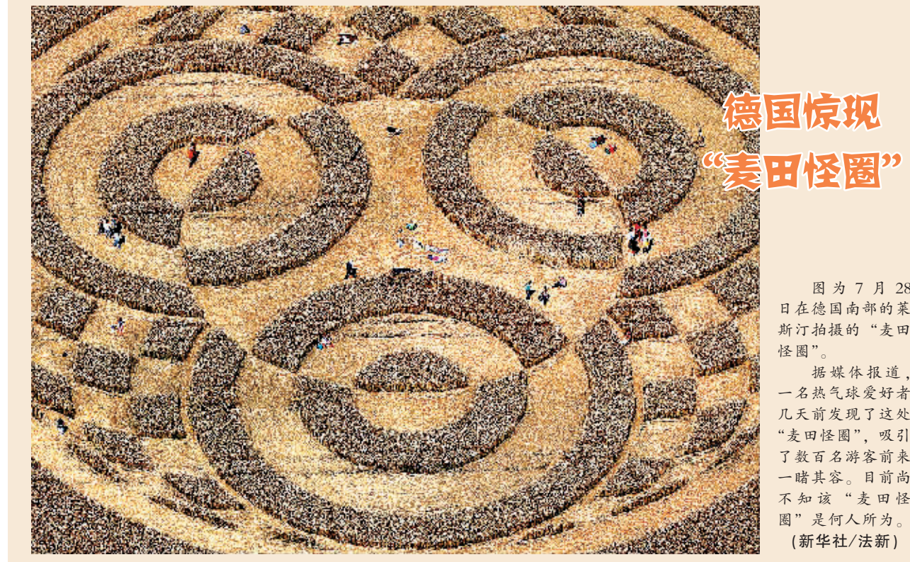
德国惊现“麦田怪圈”

截至目前，以色列尚未对哈马斯的这一说法进行回应，但据称正在对相关细节进行核实。据巴勒斯坦卫生部统计，以色列本月8日发动“护刃行动”以来已造成巴方千余人死亡，超过6000人受伤，死者大部分为平民。另据以色列方面统计，以方死亡人数已达51人，其中包括48名士兵、2名以色列公民和一名泰国劳工。