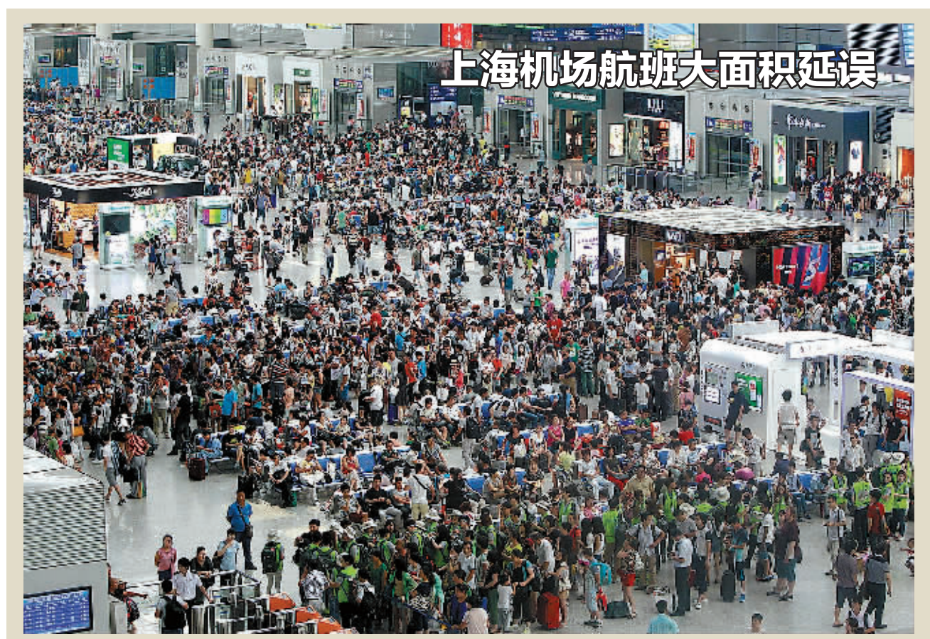
上海机场航班大面积延误

据新华社北京7月29日电 记者29日从最高人民检察院获悉，广西壮族自治区政协原副主席、总工会原主席李达球涉嫌受贿一案，经最高人民检察院指定，由吉林省人民检察院侦查终结后移送吉林省延边朝鲜族自治州人民检察院审查起诉。近日，吉林省延边朝鲜族自治州人民检察院已向延边朝鲜族自治州中级人民法院提起公诉。