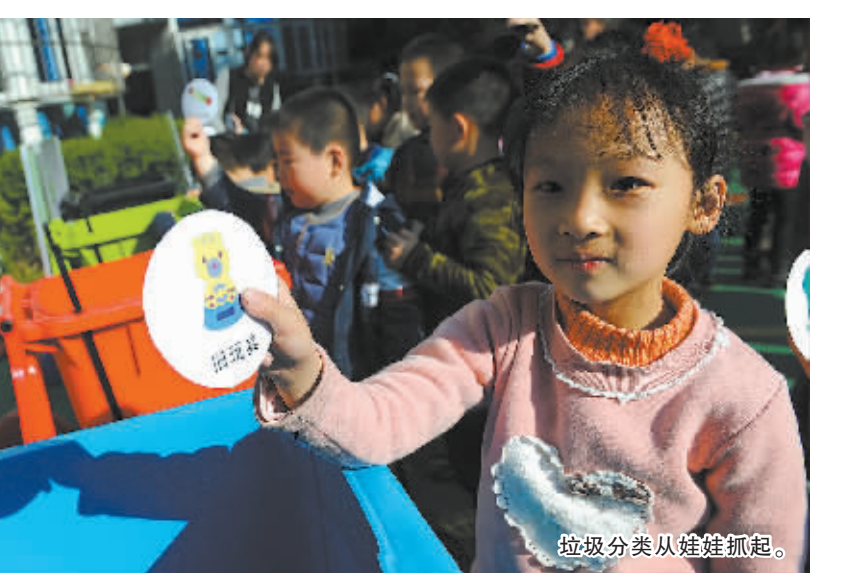
垃圾分类从娃娃抓起。

亡的关键,更是一个国家的发展战略,是社会经济成长方式在历史关键时刻的转型升级。而节俭习惯的养成,贵在坚持,贵在从小处着手。