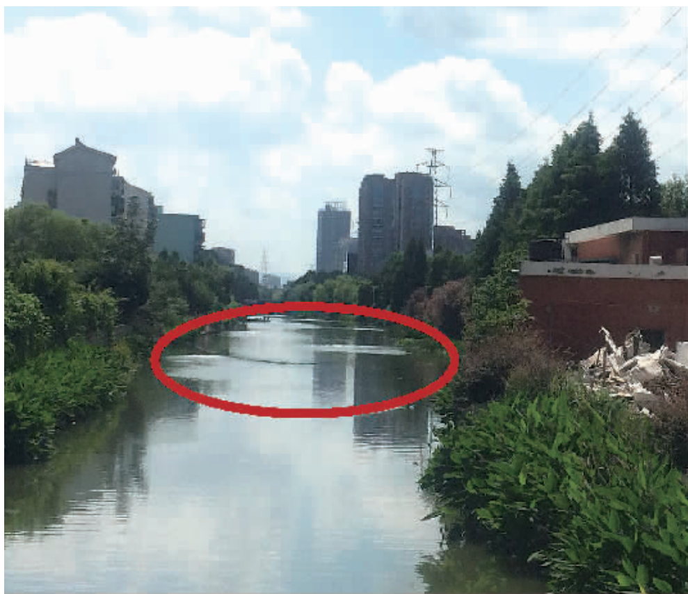
红圈处为下坠的电缆线。