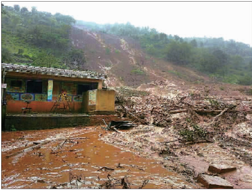
遭泥石流袭击的村庄。