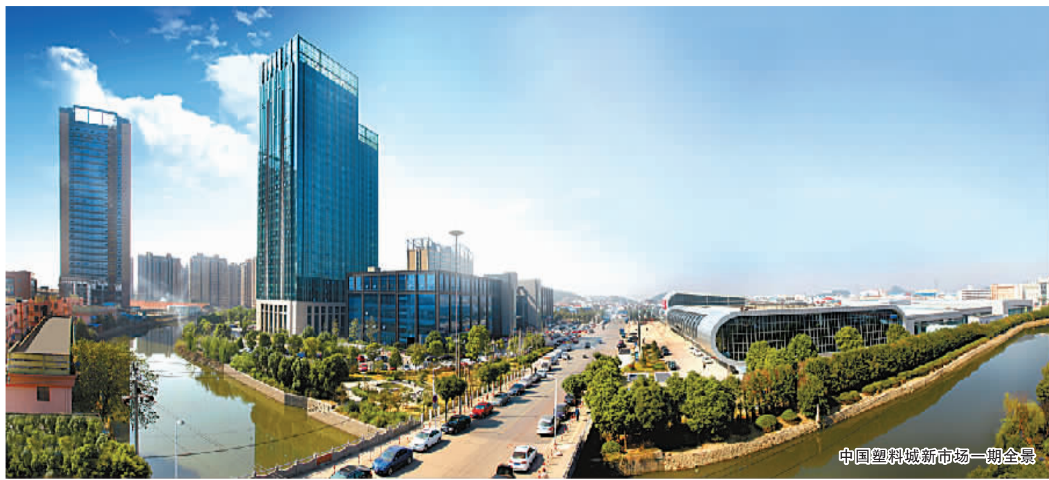
中国塑料城新市场一期全景

同时,塑料城管委会先后与深圳发展银行宁波分行、中国人民银行余姚支行及宁波银行、平安银行分别推出仓单融资战略合作项目、货物质押融资业务、网贷平安融资业务及中国塑料城企业网上融资平台,有效破解企业融资难问题。