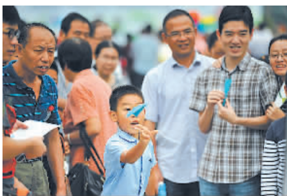
图为市民在参加射飞镖游戏。

昨天晚上,在文化广场还进行了鼓乐、独唱、街舞、排舞、拉丁舞、广场舞等表演,吸引了很多市民观看。