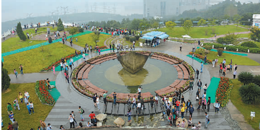
今年国庆长假是三峡大坝旅游区对中国游客实行门票免费新规定后的第一个长假。据长江三峡旅游发展有限责任公司的统计数据,截至10月1日中午12时,三峡大坝旅游区入园游客总数已突破1.1万人次,创同比新高。预计首日游客总量可突破两万人次。图为游客昨天在三峡大坝旅游景点游览。