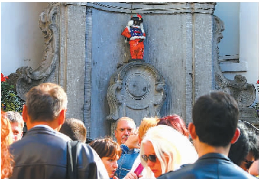
10月1日,在比利时首都布鲁塞尔,游客们在小尿童雕塑前参观。10月1日是中国国庆节,有布鲁塞尔“第一公民”之称的小尿童身着唐装与游人见面。