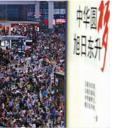
10月6日,旅客在上海虹桥火车站候车大厅等候进站。 上海铁路当日预计发送旅客28.5万人次,总计加开31对临客,主要集中在中短途。

次,其中增加航班90余班次;预计全天客流量约24.6万,同比增长超过3%。预计客流高峰将持续至7日到8日。7日南航计划增加航班100余班,8日计划增加40余班。主要集中在广州往返海口、三亚、武汉、长沙、宜昌等地,深圳往返海口、三亚等地。 重庆市旅游局6日发出提示,请国内外游客特别是自驾游游客返程时注意交通安全。由于民航交通易受天气等因素影响,特别提示游客在航班出现延误时遵守法律法规、放平心态、合理维权。