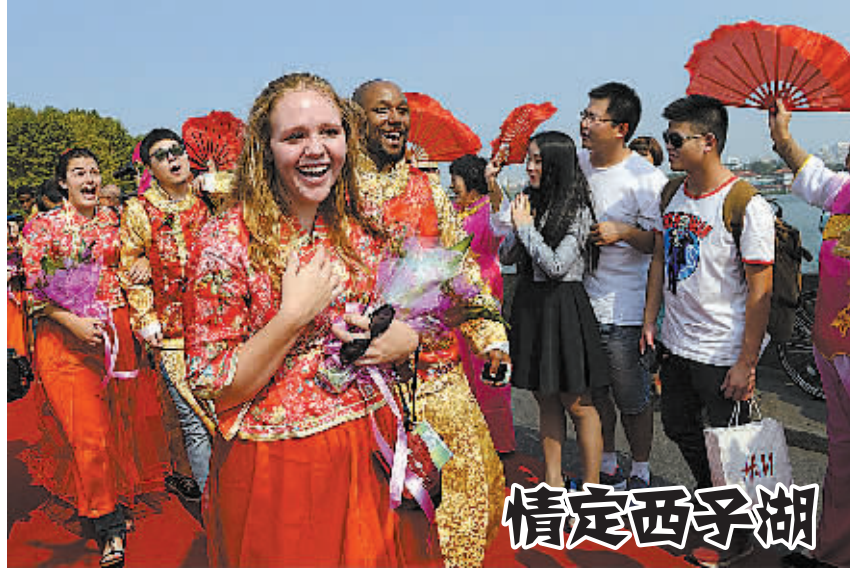
10月6日,在杭州西湖白堤,参加集体婚礼的新人走在红地毯铺成的“玫瑰大道”上。 当日,中国及来自美国、法国、德国、意大利、赞比亚、巴基斯坦等19个国家的100对新人参加在浙江省杭州市举办的2014“玫瑰婚典”。他们身着中国传统服饰,在集体婚礼中泛舟西湖,情定西子湖畔。

新华社天津10月6日电(记者周润健)10月8日,我国观测条件非常好的一次月全食将现身天宇。如果天气晴好,对此次天文奇观该如何观赏?怎样才能拍摄出效果绝佳的“月食葫芦串”?如何与“红月亮”合影?针对这些问题,记者采访了相关天文专家。 喜欢天体摄影的公众,可提前准备好相机,数码相机或胶片的都可以,来一张与“红月亮”带地景的特色合影,名胜古迹、标志性建筑物都是很好的素材。如果想拍摄近处人物与月全食的合影的话,可以适当使用闪光灯补光。 专家称,要想拍摄“月食葫芦串”,需选用能连续在同一幅画面中多次曝光的相机,并准备好三脚架来固定相机,每隔15分钟左右拍一次,就可以得到“月食葫芦串”的独特效果。当然也可以采用后期叠加的处理方法,把月全食的全过程呈现在一张照片上。 观看月全食,最好能使用带三脚架的能放大几十倍的天文望远镜。有兴趣的公众可到所在地的天文学会或天文馆、科技馆。为了迎接这次月全食,这些场所都会在当天组织市民用专业天文望远镜进行观测。 驾驶员郭先生说,他打算把船从东阳拖到杭州,就把船固定在轿车后方。虽然造型很诡异,但高速公路对小型客车免费通行,收费处并没有杆子拦着,郭先生就直接开了上去。 高速交警发现,在船只后方,只有一块三角牌具有反光效果,并没有其他具有提示功能的设施。夜间行驶,船只已经完全遮挡了汽车尾部转向灯、刹车灯和示宽灯,存在很大的安全隐患。