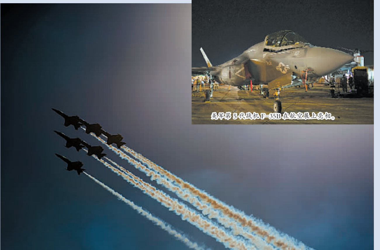
美军第5代战机F-35B在航展上亮相。

美国最大的军事航空展米拉玛航空展10月3日至5日在加利福尼亚州圣迭戈米拉玛海军陆战队航空站举行。美军最先进的战机之一F-35B、著名的“蓝天使”飞行表演队等亮相航展。