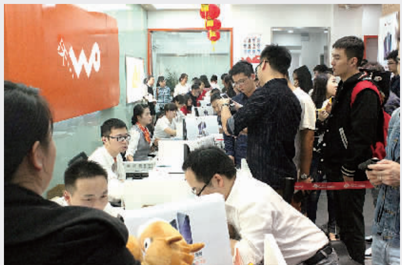
10月17日凌晨,在宁波联通江东百丈营业厅,用户争相抢购办理iPhone6/Plus。

火灾隐患令不少网友担忧升级:现在连裤兜也容不下它了!“弯曲门”还未消停,iPhone6的另一项“新功能”更让人大跌眼镜:闪亮变身新一代“脱毛神器”!网友“Peavler”常抱怨自己的头发被卡在铝材质手机外壳和玻璃屏幕之间:“不但我的头发遭殃,有时我的胡子也会被狠狠地扯掉。那感觉简直是痛彻心扉啊!”