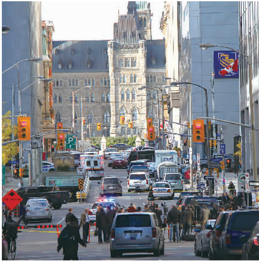
这是10月22日在渥太华市拍摄的加拿大议会大楼附近被封锁的街区，远处是加拿大议会大楼。

一枪手枪杀了国家战争纪念碑的执勤士兵后，在议会大楼内与警卫发生激烈枪战，最终被击毙