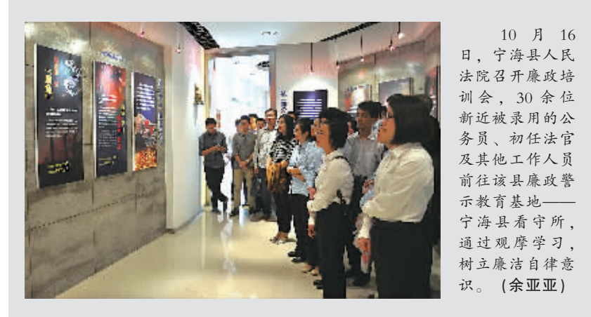
10月16日，宁海县人民法院召开廉政培训会，30余位新任近被录用的公务员、初任法官及其他工作人员前往该县廉政警示教育基地——宁海看守所，通过观摩学习，树立廉洁自律意识。(余亚亚)