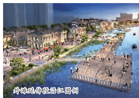
外滩延伸段沿江风貌