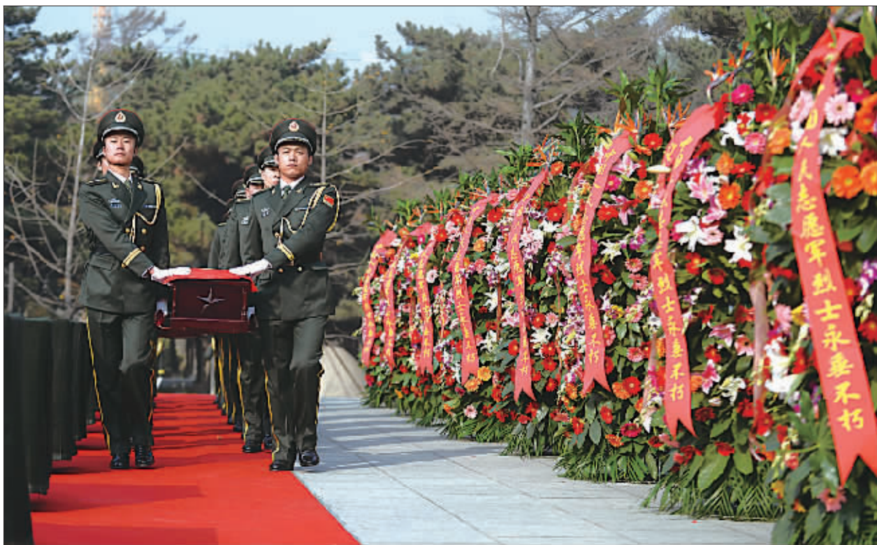
10月29日，礼兵护送志愿军烈士遗骸棺柩入场。