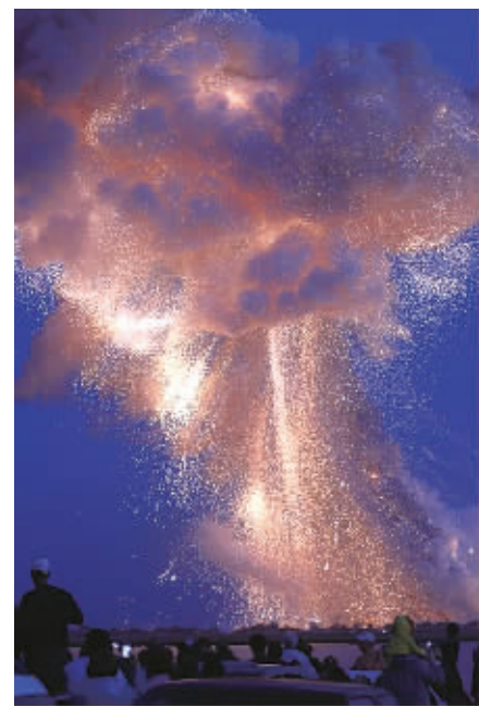
火箭在美国东海岸瓦勒普斯岛上空爆炸的画面。

每年8月到12月，斯里兰卡进入雨季，这段时间也是中部和南部山区出现山体滑坡和泥石流的高发期。