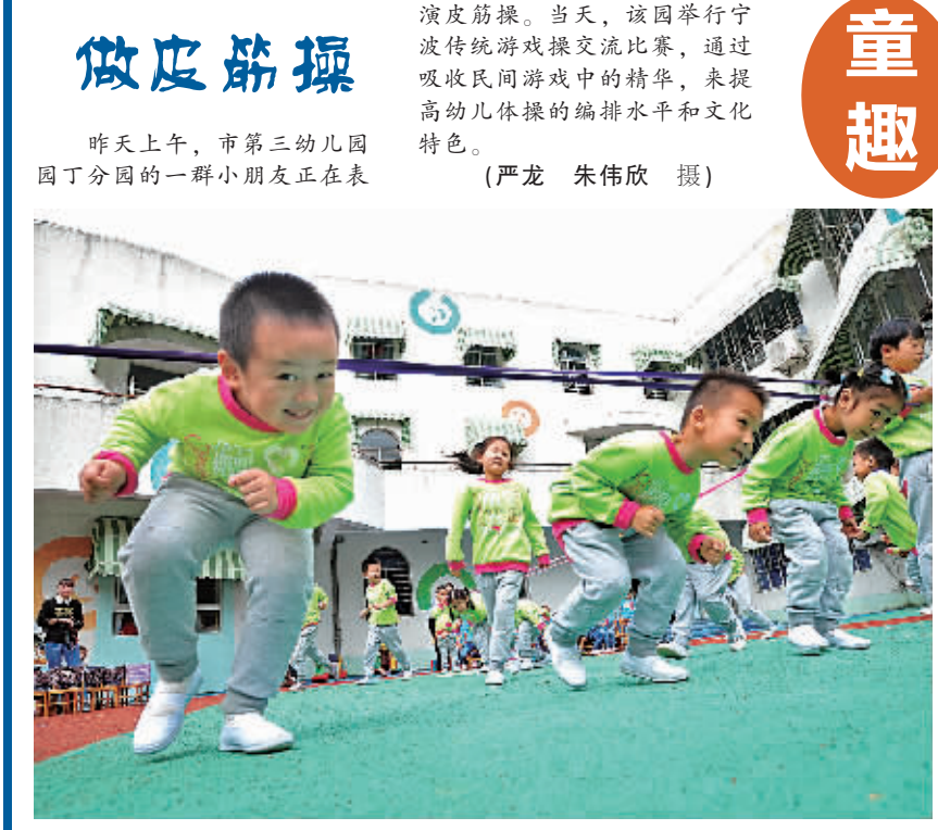
昨天上午,市第三幼儿园分园的一群小朋友正在表演皮筋操。当天,该园举行宁波传统游戏交流比赛,通过吸收民间游戏中的精华,来提高幼儿体操的编排水平和文化特色。

发挥政协优势和作用,积极为法治宁波建设建言献策;要运用法治思维,依法依规行事,推进政协工作;要认真搞好明年工作思路调研,筹划好明年工作。【上接第1版④】宁波什么时候才能真正划定可以打桩的生态红线?市人大常委会委员、法工委副主任何乐君问。市规划局局长王丽萍感谢委员对规划工作的关心。她说,我们去年启动的城市总体规划修改工作中,把生态保护作为一项重要内容,划定了12类生态保护范围,并对构筑整个市域的生态格局作了研究,规定了哪些是禁止开发的区域,哪些是限制开发的区域。这还仅仅是在生态方面走出的第一步,下一步我们将结合明年工作做好深化文章,不仅要把生态红线先在空间上落下去,而且要加强红线范围内的管控。一问一答间,将近3个小时转眼过去了。最后,寿永年代表市政府表态发言时说,这次专题询问充分体现了市人大及其常委会对关系人民群众切身利益的生态环境保护的高度重视。市政府将以高度负责的态度,认真汇总和研究各位委员、代表提出的意见建议,制定切实有效措施加以落实,继续为建设美丽宁波而不懈努力,向全市人民交上一份合格的答卷。