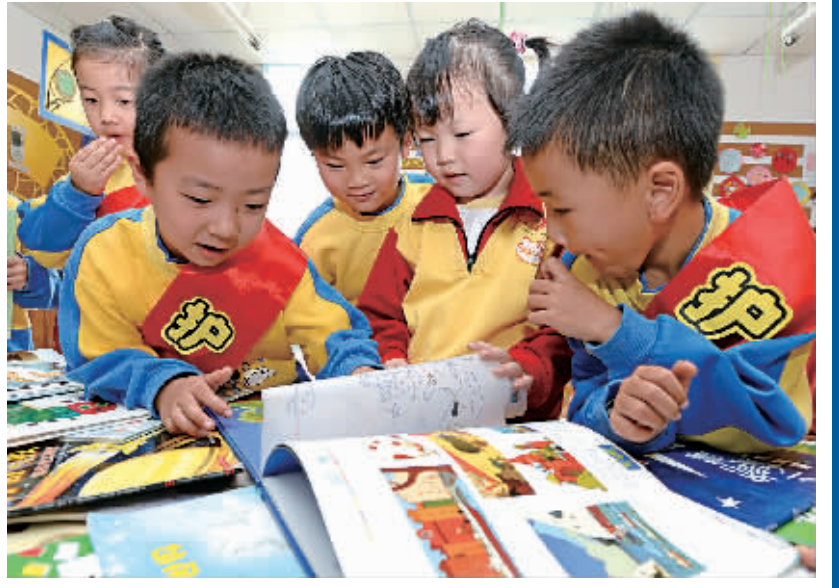
昨天下午,江东区华光幼儿园小朋友正在选择自己喜爱的书籍。为了进一步激发孩子的阅读兴趣,营造良好的“悦读”氛围,该园举行“书香满园伴成长”为主题的“图书漂流”活动,在锻炼孩子交往能力的同时也让他们有更多阅读的机会。