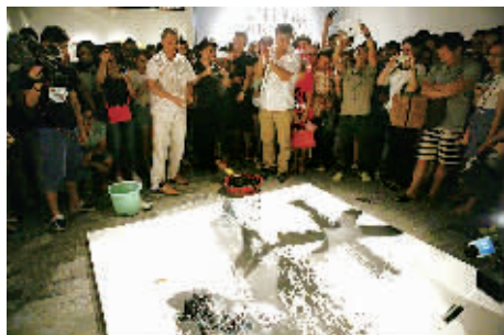
第二届宁波当代艺术展