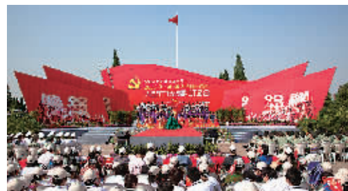
庆祝建党90周年广场诗歌朗诵活动现场

注重整合资源，坚持上下联动，积极与中国文联、省文联、县(市)区文联等共同组织、主办、合办各项活动，成功承办第九届全国水彩、粉画展、“沙孟海奖”第七届全国书法大展，积极筹备第十届中国摄影艺术节，这些活动突出了地域特色，扩大了宁波影响。去年，与中国曲艺家协会、浙江省文联等联合主办中国曲艺牡丹奖获奖节目展演，这是曲艺牡丹奖艺术团在全国的首场惠民演出，巩固汉林、李金斗、曹云金等著名曲艺家为宁波观众献上满堂欢笑。去年，经典文艺活动品牌“春天送你一首诗”首次走出宁波城区来到镇海。支持象山文联编撰《陈汉章全集》27册。积极组织青年作家研讨会、改稿会，支持、推动各县(市)区文联培养、推介文艺家。