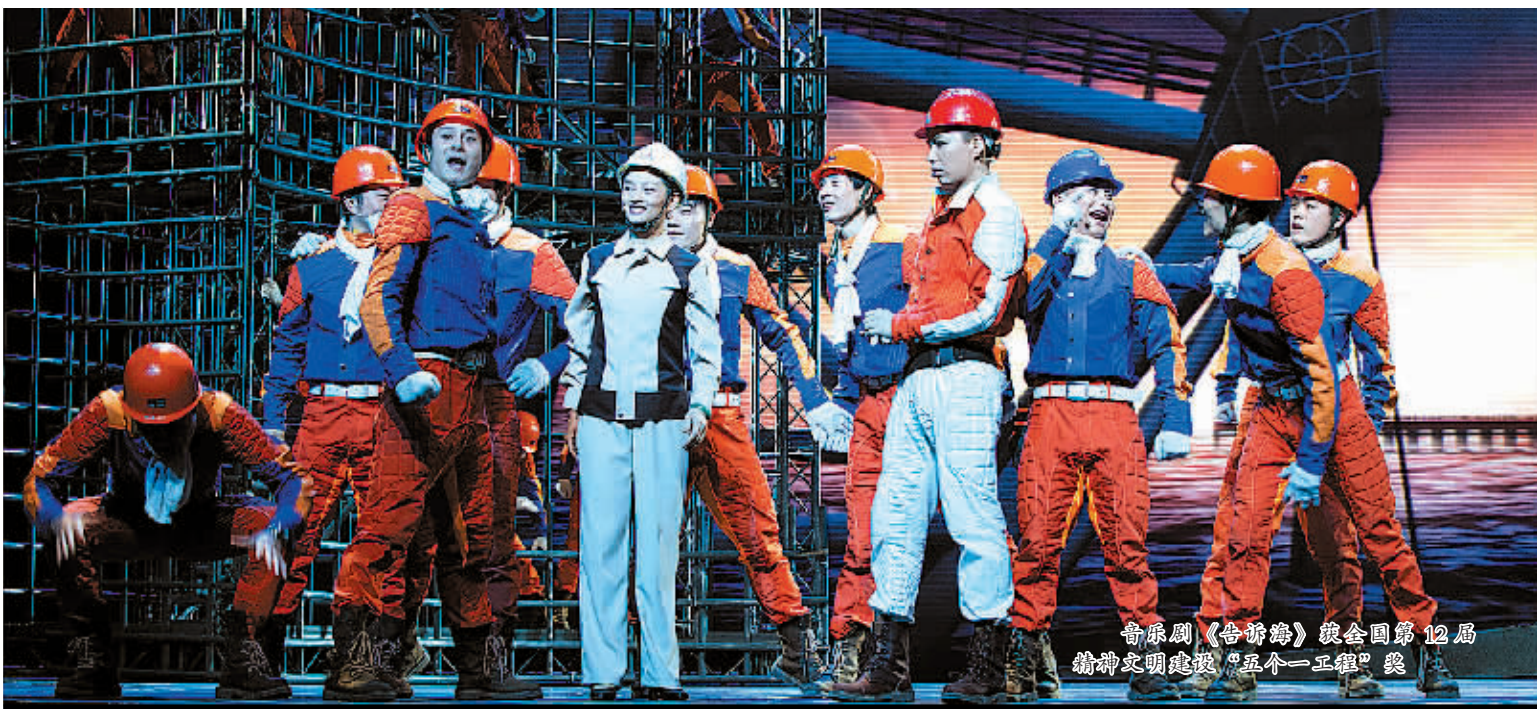
音乐剧《告辞桥》获全国第12届精神文明建设“五个一工程”奖