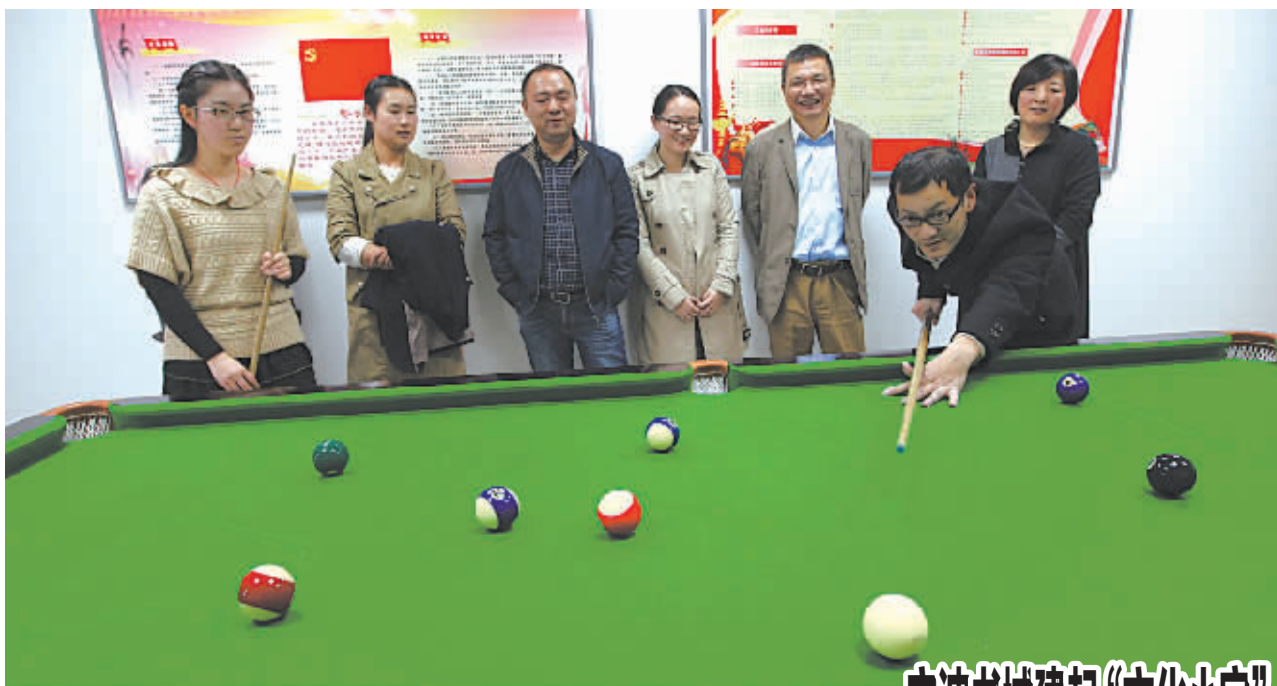
宁波书城建起“文化小家”

2011年8月落户海曙区留学生创业园的宁波邻家网络科技有限公司,是一家专注于物联网基础信息服务的高新科技企业。旗下的草料网是目前全国最大的二维码服务平台,占据国内二维码服务市场70%的份额。