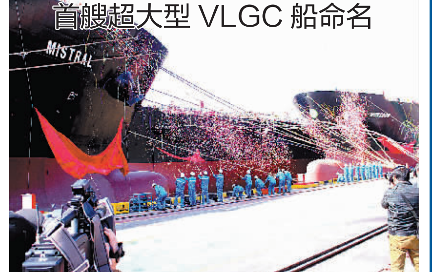
首艘超大型VLGC船命名