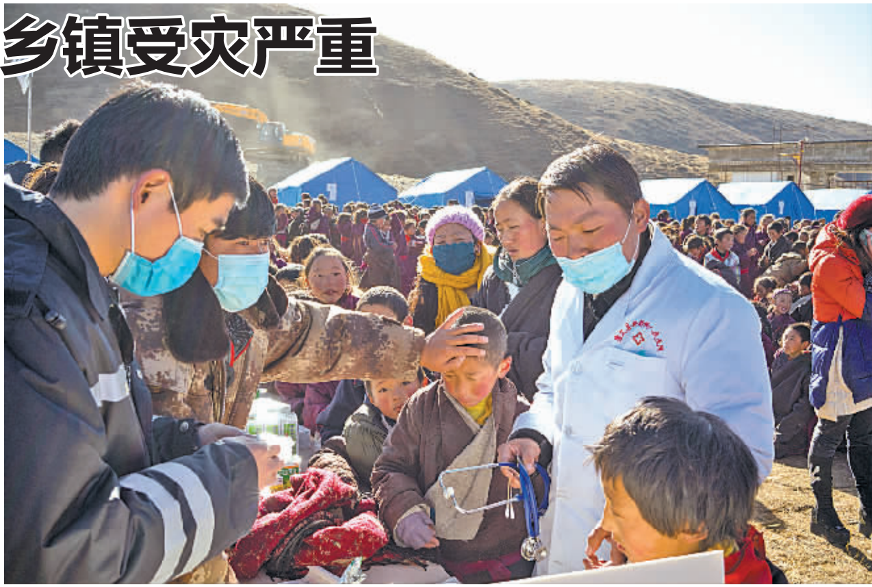
这是木雅祖庆学校的小学生在接受身体检查(11月23日摄)。当日,记者实地走访康定县塔公乡多拉村木雅祖庆学校,在现场看到该校校舍楼体外墙垮塌严重,主体结构无大部,师生已全部转移至校舍楼前空地,食宿无忧。

由于康定地区很多地方是山区、牧区,群众有散居的特点,此次地震造成的相关损失统计难度颇大,目前仍在进行统计中。