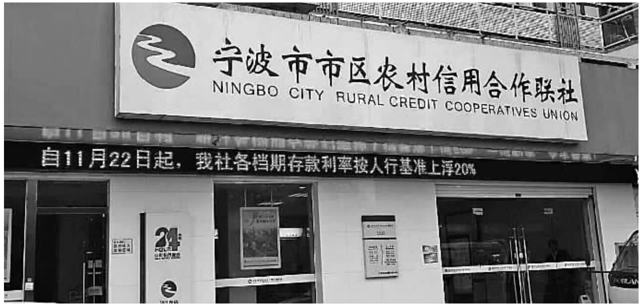
多家银行机构开始加强本次存款利率调整的宣传攻势。