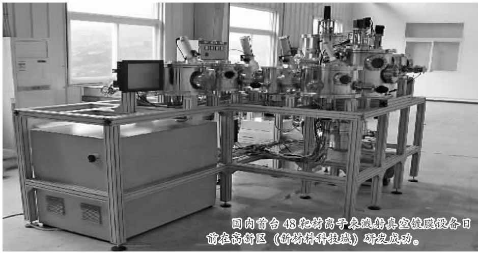
国内首台48兆材料离子束镀膜真空镀膜设备日前在高新区(新材料科技城)研发成功。

业内专家指出,材料基因组项目“扎根”高新区(新材料科技城),不仅为我市注入了国际领先的新材料研发实力,也将提升我国在材料领域的核心科技水平与工业制造能力,为我国材料研发实现“弯道超车”打下坚实基础。