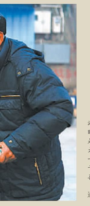
春节将至,在奉化市莼湖镇费家村码头,渔民忙着晒鱼干,一排排晾晒的鱼干,是一道亮丽的风景,更是大海对讨海人的馈赠。图为渔民夫妻正在晒满鱼干的竹网,脸上满是收获的喜悦。

于是,法院委托检察院对二人进行了心理测试。测试结果显示,小明对有关133000元借款的实际出借金额、出借次数等问题的陈述不真实;王某对有关133000元借款的借款金额、借款用途等问题的陈述真实。 因此,海曙法院采纳了心理测试报告结果,一审认定小明与王某之间70000元的借贷关系依法成立并合法有效。王某虽提出其已归还6万多元,但除34300元还款有证据予以证明以外,其余部分因未提供证据予以充分证明,法院难以采纳。小明与王某虽均认可双方借款时口头约定了利息,但双方对利息约定的标准陈述不一致,且王某出具的借条中亦未载明利息,故法院认定双方对利息的约定不明,应视为不支付利息。 近日,海曙法院宣判王某在判决生效之日起十日内一次性偿还小明借款本金35700元,利息138元;驳回小明的其他诉讼请求。(文中人物为化名)