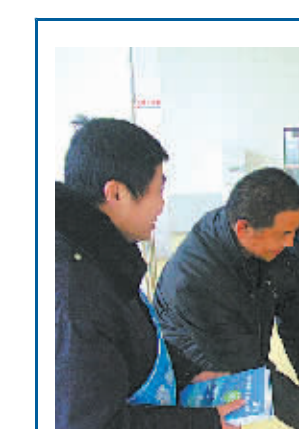
志愿者们为乘客送上一杯热腾腾的姜茶,帮他们抵御严寒。

昨天一大早,市公交总公司镇海公司“陈叶服务队”的志愿者们,来到汽车北站候车大厅,为回家的乘客送上一杯热腾腾的姜茶,帮他们抵御严寒。据悉,为给回家的乘客一分温暖,镇海公交公司开展了“热饮暖心,寒冬不冷”爱心活动,春运期间,志愿者们将在镇海各主要公交站点以及长途汽车客运中心,为乘客提供送热饮服务。