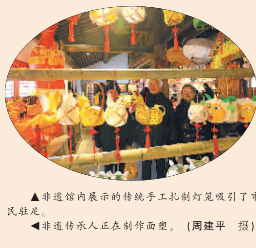
▲非遗馆内展示的传统手工扎制灯笼吸引了市民驻足。▲非遗传承人正在制作面塑。