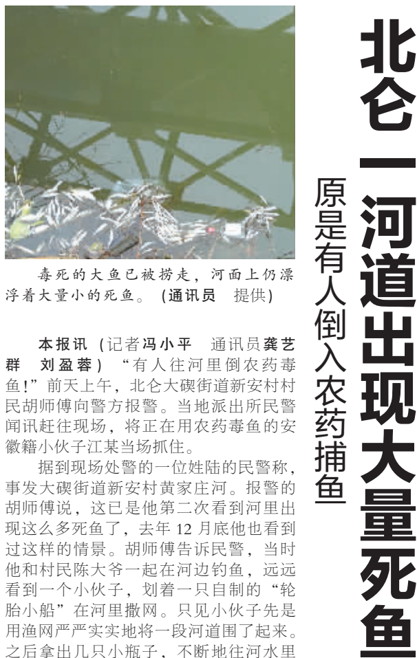
毒死的大鱼已被捞走，河面上仍漂浮着大量小的死鱼。