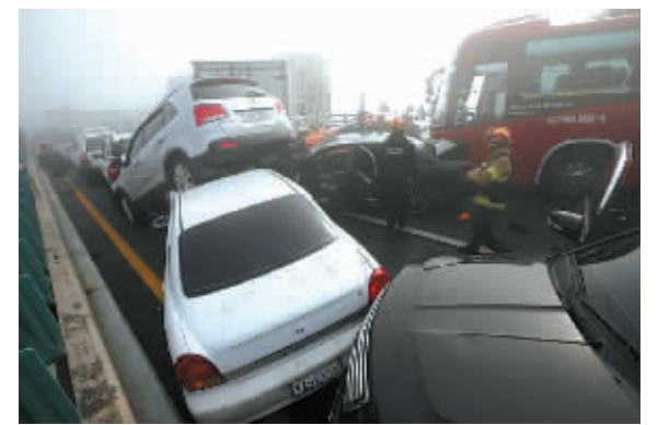
2月11日，在韩国仁川国际机场附近的大桥上，救援人员在车祸现场营救伤者。

据新华社首尔2月11日电(记者张青)据韩联社11日报道，位于韩国仁川市的永宗大桥路段当天上午9时许发生一起百辆汽车连环追尾的严重交通事故，至当天下午已致2人死亡、65人受伤，伤者中有7名中国人。