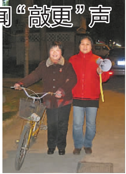
“夜呼”队回来啦!

骨干的意见,经过热烈的讨论,确定了“夜呼队”义务巡逻值班的方案,春节前“夜呼队”所有义务巡逻员正式到岗。