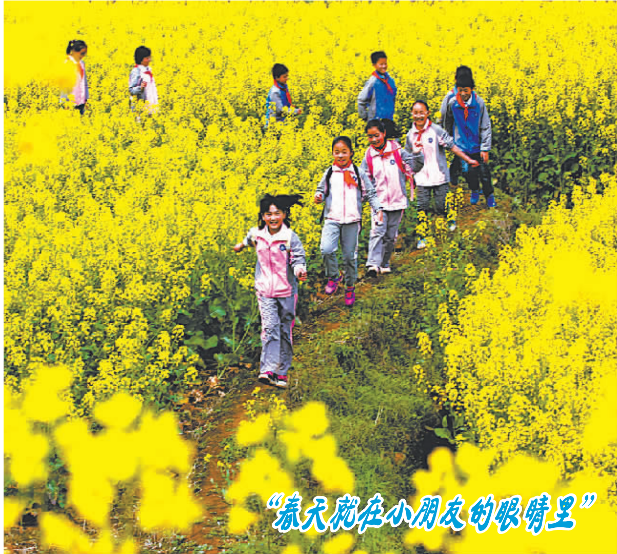
“春天就在小朋友的眼睛里”

诉。去年11月4日,中共宁波市委官方微博“东方廉政”发布微博,据宁波市纪委有关负责人证实,宁波市重点建设工程招标投标办公室原主任汪多根涉嫌严重违纪,目前正接受组织调查。