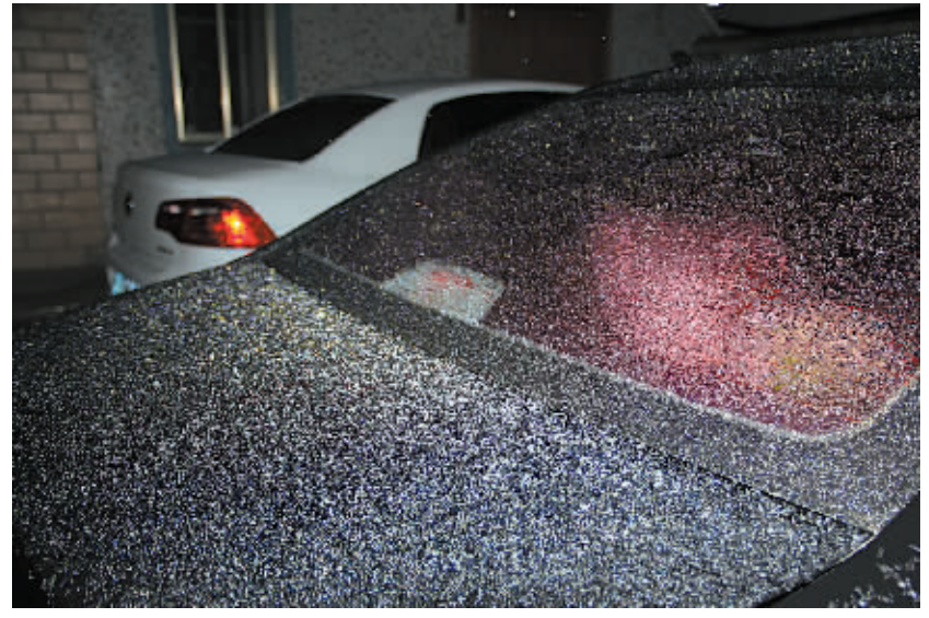
昨天,随着冷空气南下,气温骤降,四明山气温下降至0℃。昨晚6时10分,四明山区下起了雪子,并持续了20多分钟,车上、菜叶上都披上了一层白白的雪子。隔日如隔季,山区村民再次披上了棉袄。