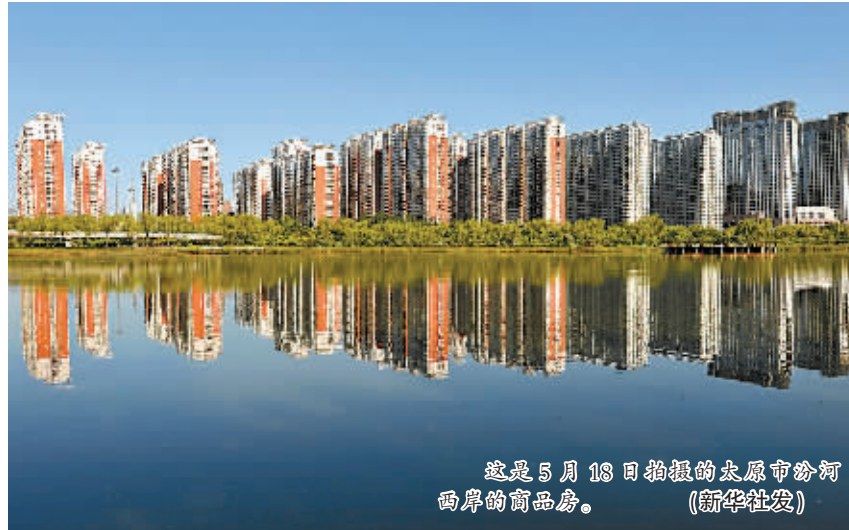
这是5月18日拍摄的太原市汾河两岸的商品房。

打通存量商品房和保障房的对接通道，成为一剂药方。国土资源部和住房城乡建设部近期联合发文，提出将符合条件的商品房住房作为棚改安置房和公共租赁住房房源。