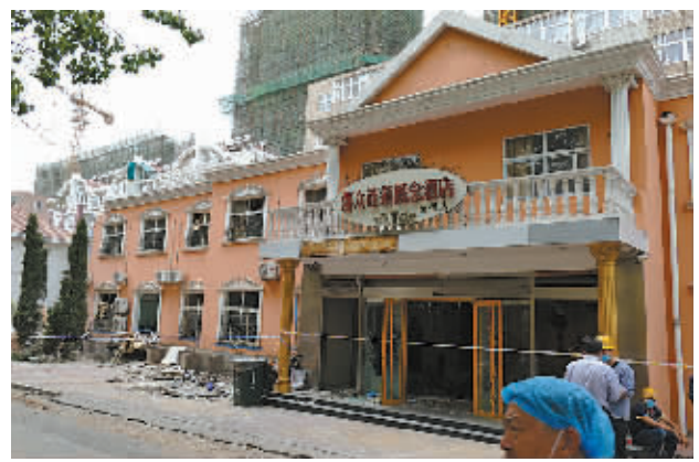
据青岛市人民政府新闻办公室通报，5月19日凌晨，青岛市市南区的喜众连锁概念酒店颐荷店发生液化气爆炸，已造成2人死亡，10余人受伤。受伤人员已送到医院救治，目前暂无生命危险。爆炸原因现已展开调查。图为青岛喜众连锁概念酒店颐荷店液化气爆炸现场。