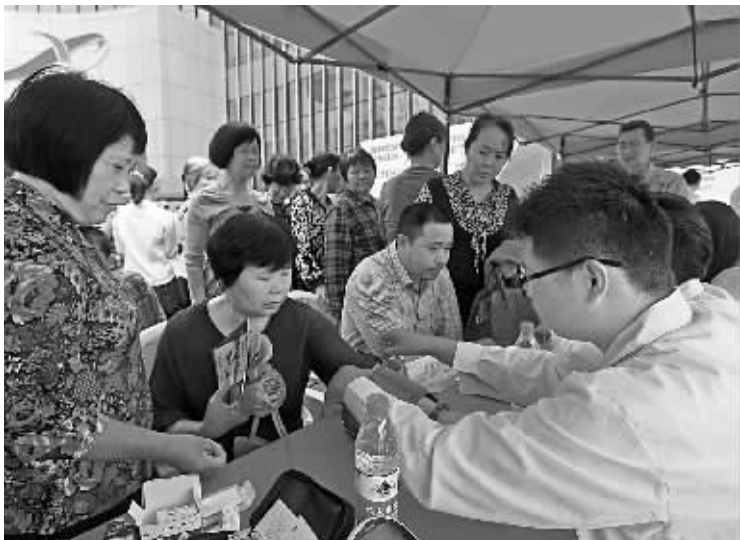
专家在为居民测量血压。

本报讯（记者 王博 江东记者站 杨磊 通讯员 韩海军 李超）昨日上午，世纪东方广场人潮涌动，江东区统一战线专家服务团正式成立，7个民主党派和6个统战团体的专家团为200余名群众提供了医疗健康、考生心理、食药安全监测等方面的咨询服务。专家团现场与区民政局下属社会机构签订了四项公益合作项目。这种由统战部门牵头，集中管理、项目化运作，让民主党派和统战团体“抱团”为百姓服务的模式，在我市尚属首创。