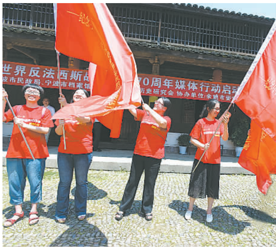
在启动仪式上，寻访记者挥舞旗帜。

弘扬民族精神、抢救抗战记忆是这次寻访的一个重要目的。主办单位希望通过寻访和报道，将那些已经步入人生最后华章的抗战亲历者所讲的故事记录下来，为国家及宁波这座城市留下更多的抗战记忆。寻访期间，宁波日报除了在报纸上发出稿件外，还将通过微博、微信等新媒体发布寻访内容。