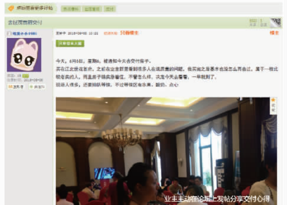
业主主动在论坛上发帖分享交付心得

业主感受到开发商的诚意,加之江北实验小学学区的确定,业主开始期待交付,期待住进小区的未来。而之前一次又一次的沟通成为了首府顺利交付的基石。交付后,有很多业主自发在各大网络、论坛为首府点赞,对社区的喜欢溢于言表。