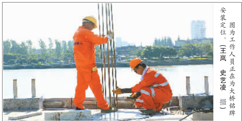
因为工作人员正在为大江桥牌安装定位。

“桥梁主体已经完工，正在进行桥体外立面装饰。”建设单位市政工程公司项目负责人廖经理介绍，大桥的装饰非常有特色，是个精细活，装饰班组40余人从去年12月开始施工，至今完成了约八成。记者看到，桥梁侧面均已铺挂上淡蓝色泽石材，立面凹凸有致，呈现极强的立体感。拱形桥梁上方，是一溜多重拱门装饰，外观与