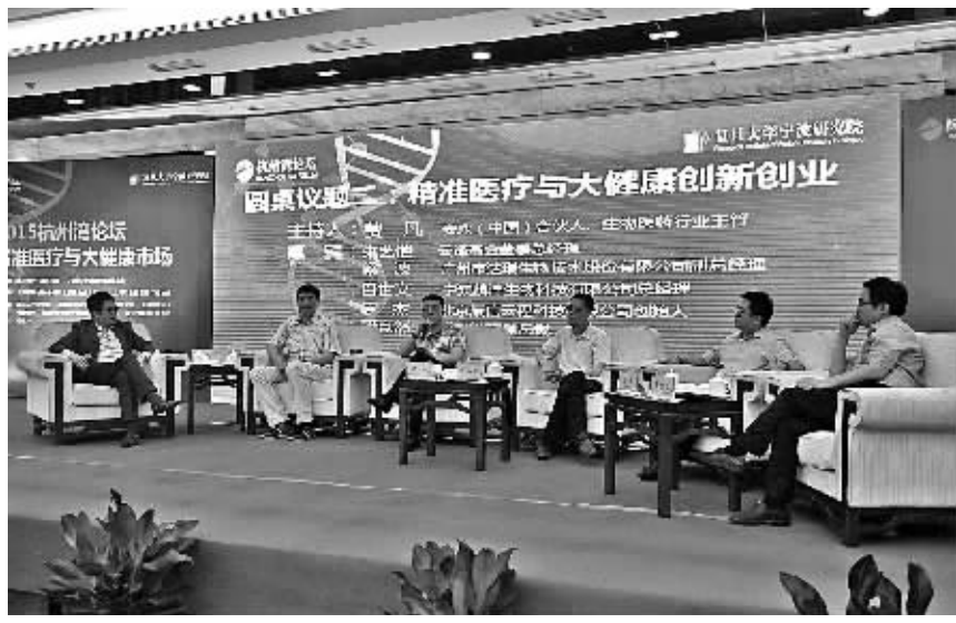
产业界和投资人热议大健康产业创新创业。

随着现代医学科学的融合发展,从过去谈论的“系统到细胞”到现在“从生物学,到环境,到社会,到行为”,医学已经在潜移默化中和科技形成了交融发展。精准化、远程化和微创化也越来越被医学界所提及。