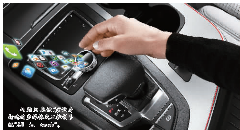
均胜为奥迪Q7量身打造的多媒体交互控制系统“All in touch”。

“均胜电子近年来的迅猛发展,是内生式增长和外延式发展双轮驱动的结果,这样的创新合力正是均胜向前发展的动力。”王剑峰说。依托对未来驾驶的深刻理解,这只宁波的“中国汽车电子第一股”,正向车联网、智能制造、新能源等领域开足马力,厚积薄发。