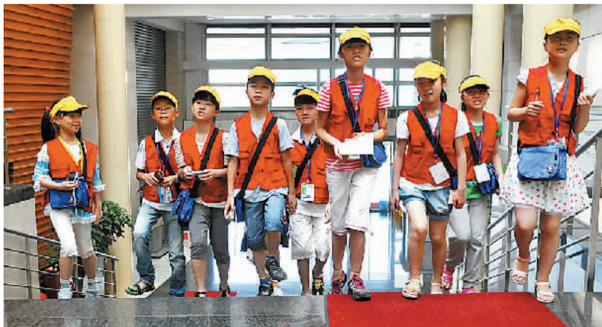
在宁波日报报业集团成立10周年之际，宁波晚报小记者应邀来到报业大楼参观体验。

值得一提的是，晚报还特别为小记者们组织了一场座谈会，邀请了曾经是晚报小记者的大记者们和他们面对面交流。共同的经历让他们有更多的共同语言，大记者们为小记者答疑解惑，并为他们提供了不少写作的线索和方法。座谈会结束前，意犹未尽的他们还互留电话号码和QQ号，以便以后继续交流。