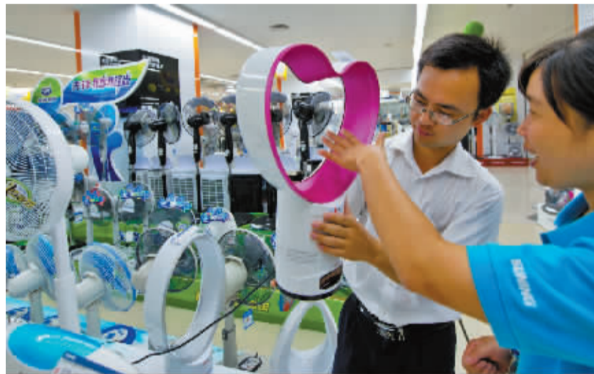
无叶风扇成今年风扇亮点。

也有专家认为，即使有公众责任险做保障，菜场等仍需确保营业场所的安全，使拥有的建筑物、道路、设备等处于坚实、良好、可供使用的状态，对已经发现的缺陷应予以立即修复，并采取临时性的预防措施以防止发生事故。同时，超市也可通过加强对清洁人员的培训、设置地板防滑标志等措施确保消费者安全。