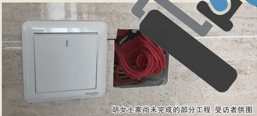
胡女士家尚未完成的部分工程