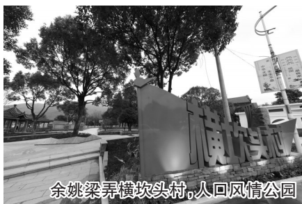
余姚梁弄横坎头村,红村风情公园

2018年2月28日,习近平总书记寄给横坎头村全体党员的一封信,让革命老区余姚梁弄红村横坎头的村民乃至全体宁波人心潮澎湃。横坎头这个“浙东红村”15年来,按照习总书记当年的嘱托,传承红色基因,引领绿色发展,率先完成了从贫困村到革命老区建设样板村和乡村振兴示范村的嬗变,成为了全国知名的“红村”。