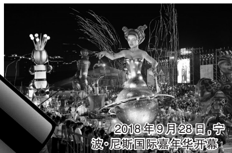
2018年9月28日,宁波·尼斯国际嘉年华开幕

2018年9月28日至10月3日举行的宁波·尼斯嘉年华,是中国-欧盟旅游年重点官方节目,也是宁波迄今引进的最大规模国际文旅合作项目,观演人数15万人次,成为宁波建设文化强市进程中的又一张名片,同时深度服务于宁波“国际性休闲旅游目的地”建设目标,打响“海上丝绸之路文化旅游名城”品牌。