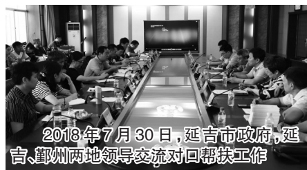
2018年7月30日,延吉市政府,延吉、鄞州两地领导交流对口帮扶工作

对口帮扶,共赴小康。2018年,宁波按照中央和省市委部署,牵手黔东南州、吉林延边等地区,在农业、工业、卫生、教育、旅游等多领域给予“深一度”对口帮扶,锻造了一支克难攻坚、创新方法的“宁波铁军”,留下了一支“带不走的帮扶队”。