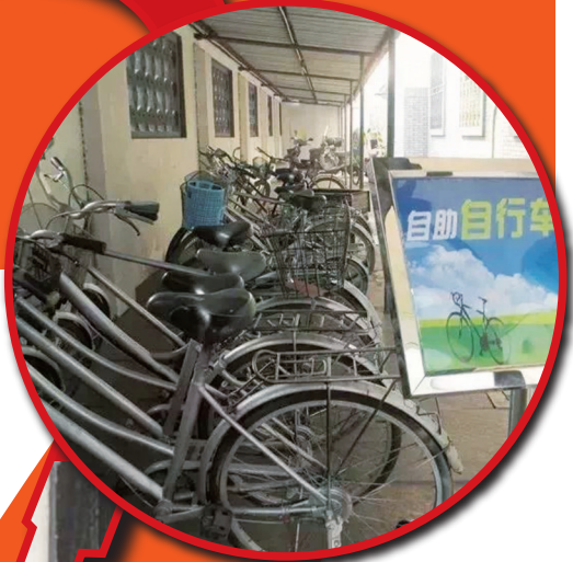
免费自助 自行车项目