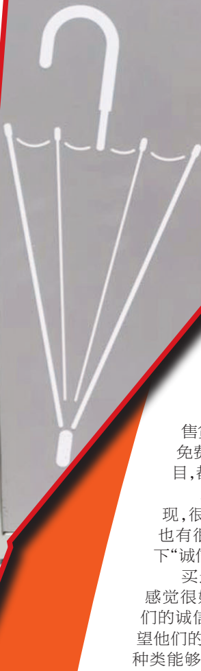
校园里的漂流伞 通讯员 供图