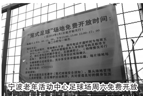
宁波老年活动中心足球场周六免费开放

昨天,金报记者随机对20位市民进行了问卷调查,相当一部分市民表示,他们以为学校的体育设施是学生专用的,是不会对外开放的,对于免费的开放地,更是知之甚少。