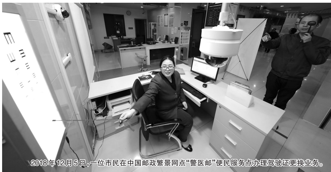
2018年12月5日，一位市民在中国邮政繁星网点“警医邮”便民服务点办理驾驶证更换业务。