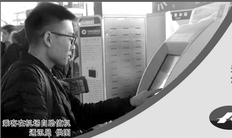
乘客在机场自助值机