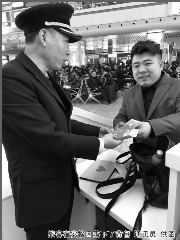
旅客在安检口落下了背包